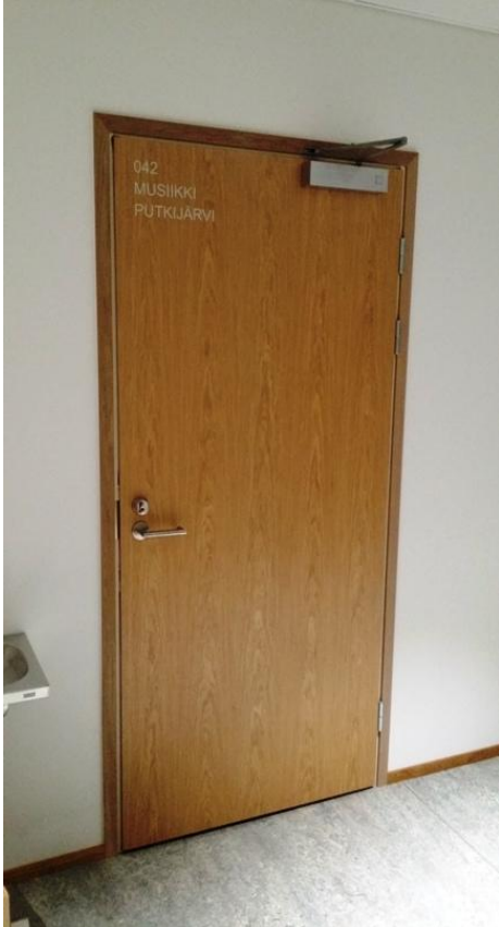
042 Musiikki Putkijärvi